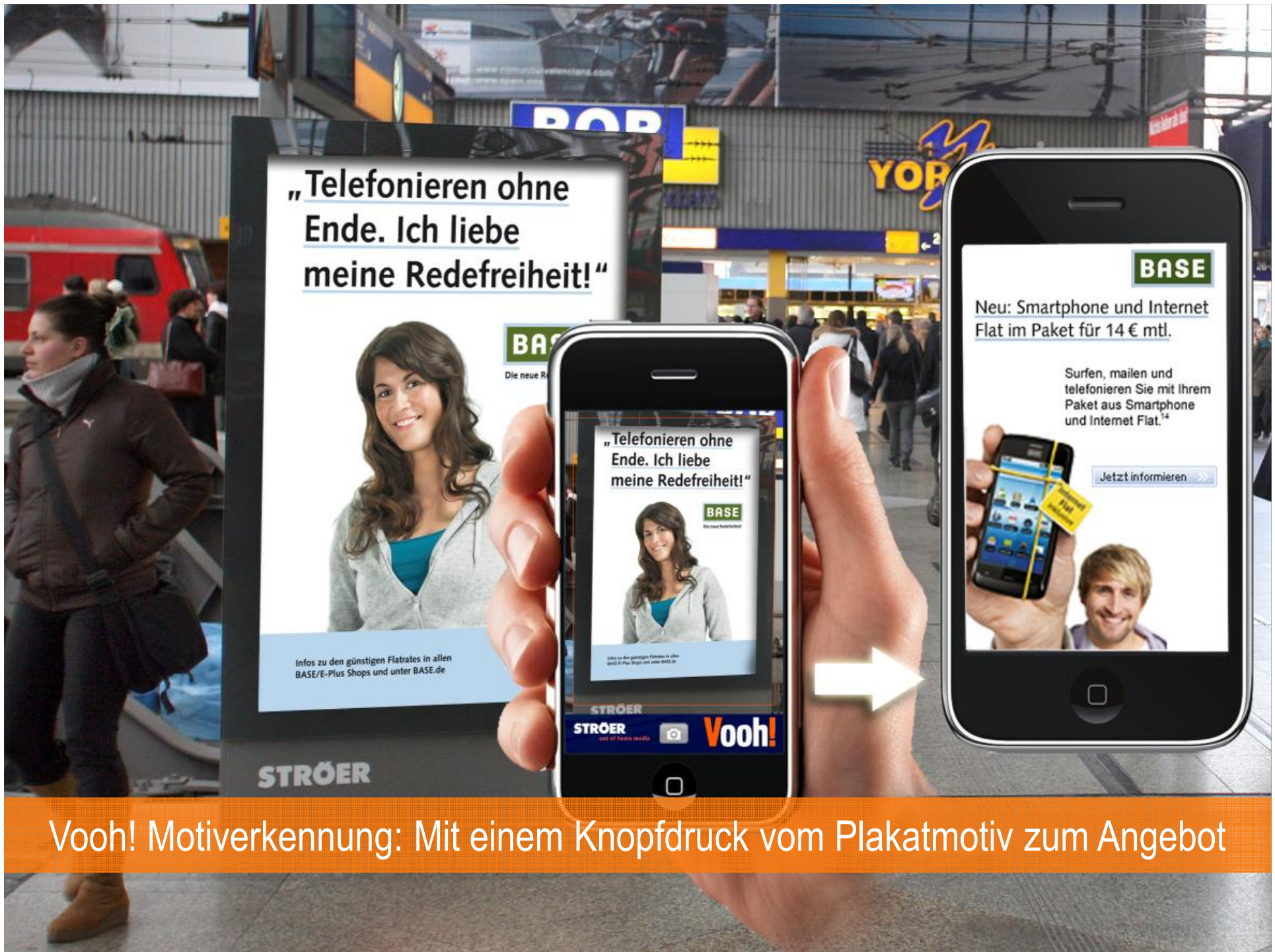
Vooh! Motiverkennung: Mit einem Knopfdruck vom Plakatmotiv zum Angebot