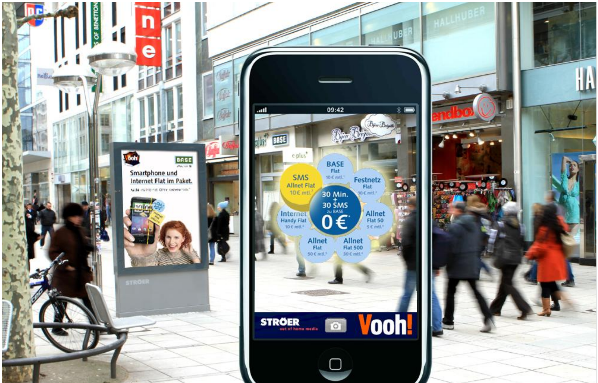
Fiktives Beispiel: Augmented Reality: Entertainment im Werbeträgerumfeld